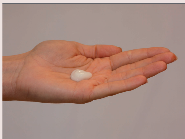
RELAXANWENDUNG Die Menge entspricht ca. der Größe von 2 Haselnüssen