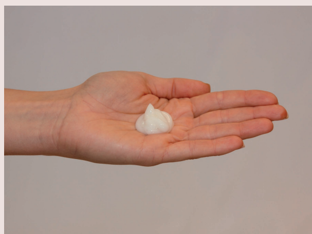
INTENSIVANWENDUNG Die Menge entspricht ca. der Größe von 3 Haselnüssen