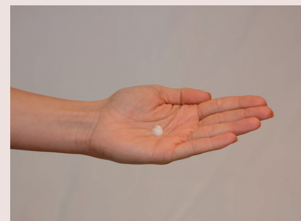
PFLEGEANWENDUNG Die Menge entspricht ca. der Größe von 1 Haselnuss